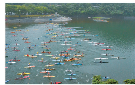
色とりどりのカヌーが5kmと10kmのレースを開催