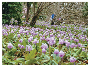
春の訪れとともに花咲くカタクリの群生地