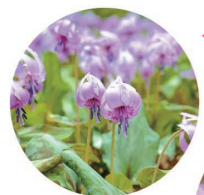
紅紫色の可憐な花を咲かせるカタクリ