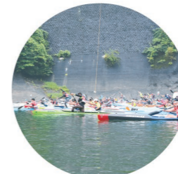
水源の町、山北を漕ぐ爽快な催し