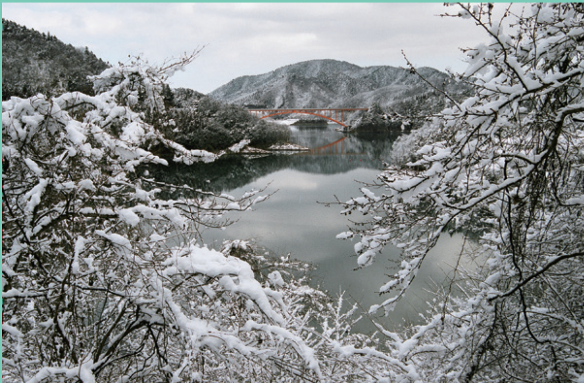
冬の宮ヶ瀬湖（神奈川県愛甲郡清川村）

自然のなかの素材を、地域に伝わる技術で加工。 あなたにぴったりの一品を見つけてみて。