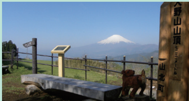
大野山山頂（足柄上郡山北町） 山頂は、丹沢、富士山や箱根の山々がみられる絶好の展望台。