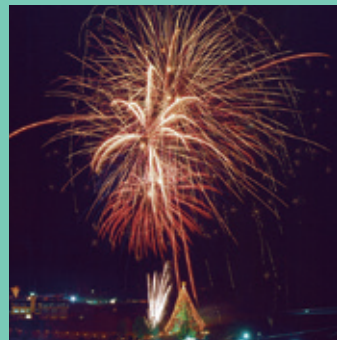
クリスマスイベント（宮ヶ瀬湖）

都心から約50キロメートルという近さが魅力で、冬も雪化粧がきれいな宮ヶ瀬湖。 夏から秋まで、初心者がカヌーを体験することができたり、 冬はクリスマスイルミネーションもある。家族で楽しめる魅力いっぱいのエリア。