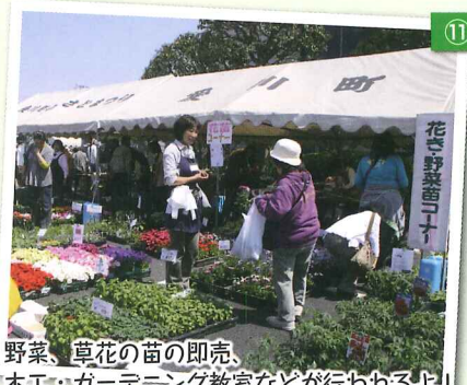
野菜、草花の苗の即売、木工・ガーデニング教室などが行われるよ!