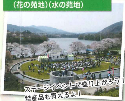
ステージイベントで盛り上がる! 特産品も買えるよ!