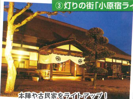
本陣や古民家をライトアップ! をばら本陣焼やうどんの販売も!