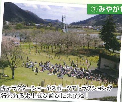
キャラクターショーやスポーツアトラクションが行われるよ! ぜひ遊びに来てね!