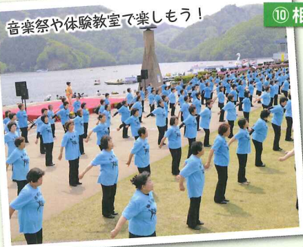
音楽祭や体験教室で楽しもう!