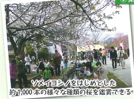
マイヨシロをはじめとした約1,000本の様々な種類の桜を鑑賞できる!