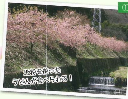
地粉を使った うどんが食べられる!