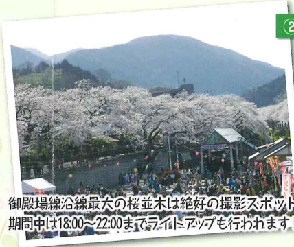
御殿場線沿線最大の桜並木は絶好の撮影スポット! 期間中は18:00～22:00までライトアップも行われます!