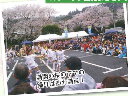
満開の桜の下での踊りは迫力満点!