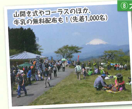
山開きやコーラスのほか、牛乳の無料配布も! (先着1,000名)