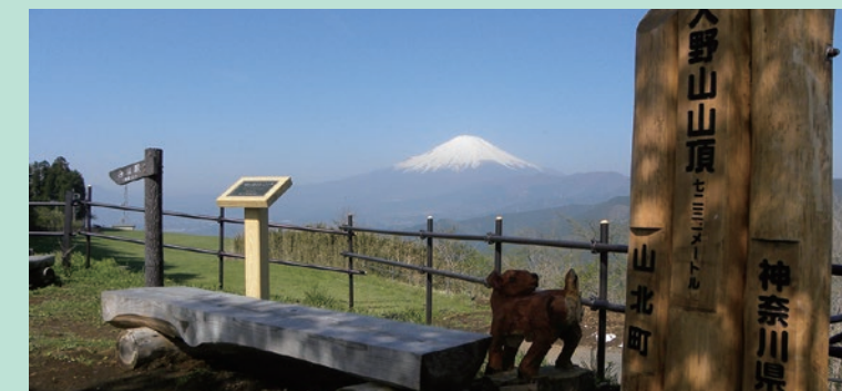
大野山山頂(足柄上郡山北町) 山頂は、丹沢、富士山や箱根の山々がみられる絶好の展望台。