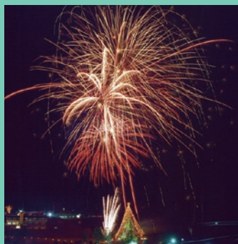
クリスマスイベント（宮ヶ瀬湖）

都心から約50キロメートルという近さが魅力で、冬も雪化粧がきれいな宮ヶ瀬湖。夏から秋まで、初心者がカヌーを体験することができたり、冬はクリスマスイルミネーションもある。家族で楽しめる魅力いっぱいのエリア。