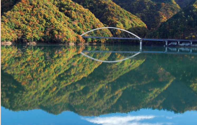
盛秋の宮ヶ瀬湖 (愛甲郡清川村宮ヶ瀬)