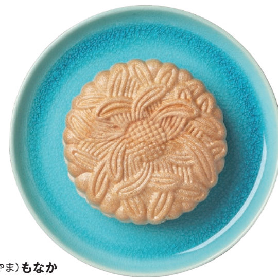
AREA 愛川町 2018 NEW01

水源地域の自然や伝統文化を伝え、地域を活性化し、 地域への理解を深めていただくために開発された特産品。それがやまなみグッズ。 このたび7商品が新たに認定された。 作り手が味や素材にこだわり、水源地域の自然の恵みを感じさせる品々。