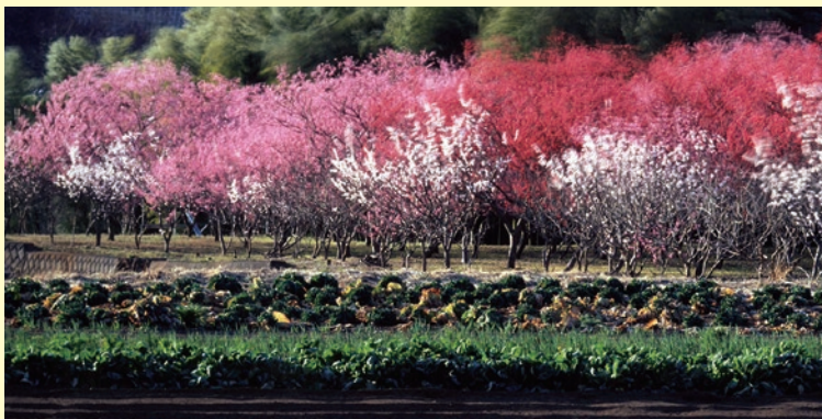
山里の春（相模原市緑区津久井地域）

豊かな自然で育まれた果実を手間ひまかけて加工。 農薬を使わず、甘さ控えめで、パンやクラッカーなどにピッタリ。 ご家族での朝食などにぜひ。