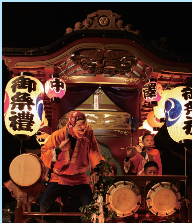
中澤礪子連 相模原市緑区城山地域

60. AREA 相模原市緑区 相模の地酒「相模灘」 手造りで醸した極上の一滴 久保田酒造(株) ☎ 042-784-0045 取り寄せ可 純米吟醸/1,500円、特別純米酒/1,400円、 特別本醸造/1,150円(各720ml) 洗米から上槽まで、手間を惜しまぬ 造り方で、米の旨味を充分に生かし た口当たりさわやかな日本酒。