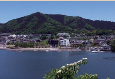
相模湖 相模原市緑区

釣りやボートが楽しめ、周辺には石老山ハイキングコースや相模湖交流センターもある。