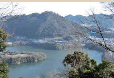
津久井湖 相模原市緑区