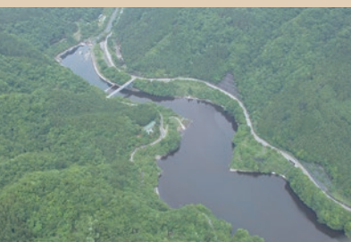
奥相模湖 相模原市緑区

釣りやボートが楽しめ、周辺には石老山ハイキングコースや相模湖交流センターもある。