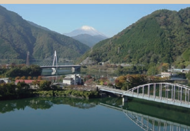
丹沢湖 足柄上郡山北町