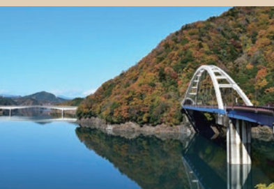
宮ヶ瀬湖 愛甲郡清川村